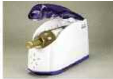
Paso 2: Introduzca su bebida