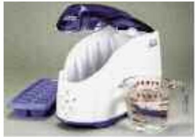
Paso 1: Añada hielo, agua y conecte a la corriente