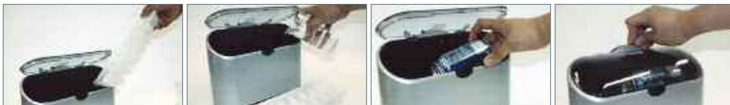
1. Añada hielo

Es el regalo ideal y perfecto para fiestas en las que hay una alta demanda de bebidas frías.