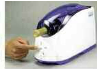
Paso 3: Seleccione una función