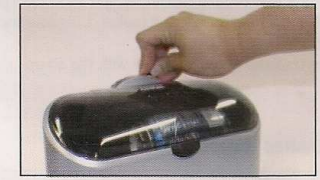
4. Cierre la tapa y seleccione tiempo

Por favor: Aunque los tiempos están pre fijados para su mejor funcionamiento, los ciclos pueden pararse en cualquier momento simplemente apretando el botón de la tapa para abrirla, lo que lo parará automáticamente o situando el mando de tiempo en la posición OFF.