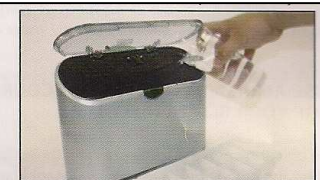
2. Add 1.5 cups of water