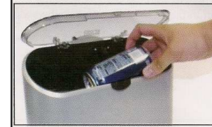
3. Sitúe su bebida en el eje